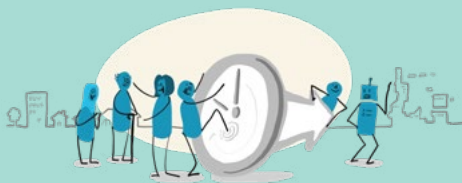
De diverse bevolking van Nederland: samenleven nu en in de toekomst