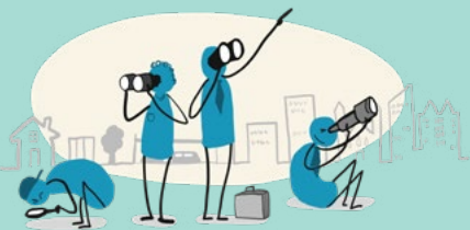
Beleidsvisies, burgervisies en gedragingen

het programma hieronder om meteen naar de beschrijving van het programma te gaan). Dit zijn meerjarige onderzoeksprogramma's die vooralsnog vijf jaar op de meerjarenonderzoeksagenda van het SCP staan. Dat betekent dat de geformuleerde onderzoeksvragen niet allemaal in 2021 zullen worden geadresseerd en dat we de mogelijkheid houden om op nieuwe en actuele beleidsvragen of maatschappelijke kwesties in te gaan die binnen de werkwijze en expertise van het SCP passen.