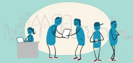
Representatie en vertrouwen