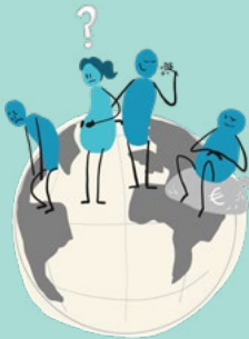
Schaarste, welvaart en welbevinden