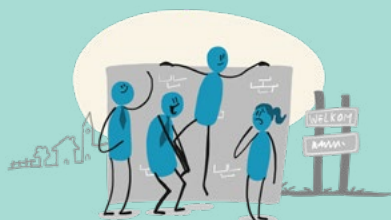
Lokaal: het sociaal domein en de kracht van de lokale verzorgingsstaat