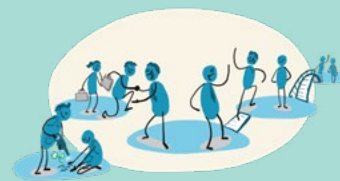
Participatie, talentontwikkeling en kansengelijkheid